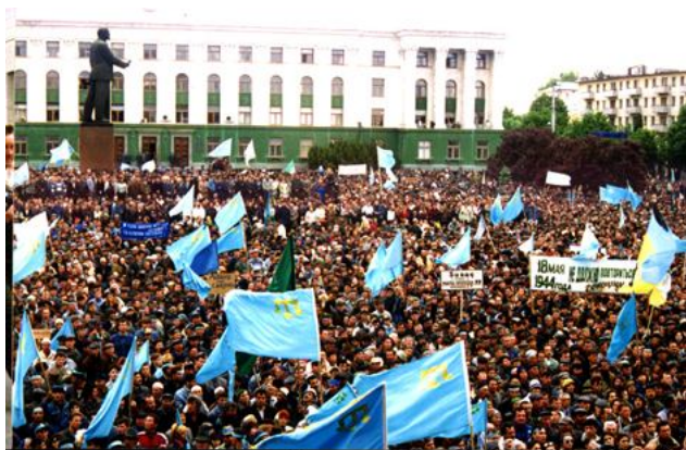
40-тысячный митинг крымских татар на центральной площади в Симферополе 18 мая 1999 г.

18 майыс бутюн миллетимиз ичюн буюк фаджиа, матем кунюдир. Халкымыз сюргюнлигинден 64 йыл кечти. О вакыттан берли ватандашларымыз чокъ хорлукълар башындан кечирди. Ич бир кырымтатары шу кунълерни унутмайджакъ ве озъ эвлятларына унуттырмаз. Шунынъ ичюн эр йыл ватандашларымыз сиясий митинг отькермек ичюн Акъмесджитнинъ меркезинде топланалар. Матем куню хатыра дуалары окъула.