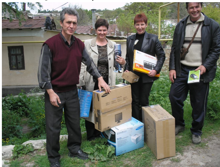
Школьной газете быть! (г. Бахчисарай).

Многие дети хотят попробовать себя в роли журналиста, корректора, редактора, и уже делают первые шаги.