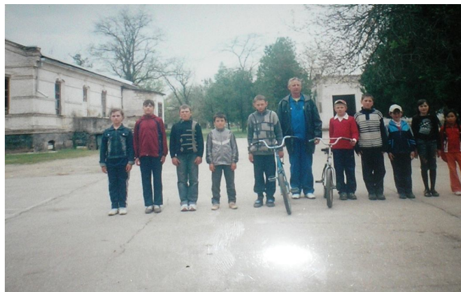
К соревнованиям готовы!

Ребята показали отличные знания по оказанию первой помощи пострадавшим. Проявили сноровку, внимательность, ловкость в управлении велосипедом.